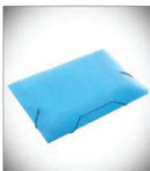
Pasta com aba (plástico) Composição: polipropileno políonda; Dimensões (350 mm X 235 mm)