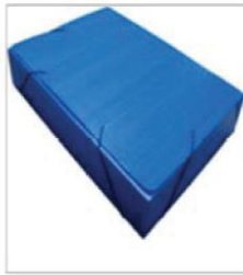
Pasta com aba (plástico) Composição: polipropileno políonda; Dimensões (350 mm X 235 mm X 20mm)