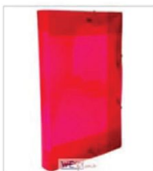
Pasta com aba (plástico) Composição: polipropileno políonda; Dimensões (350mmx235mmx20mm)