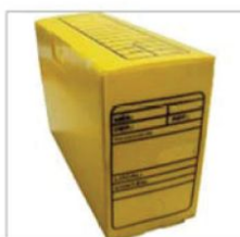
Arquivo morto (plástico) Composição: polipropileno políonda; Dimensões: (350 mm X 130mm X 245 mm)