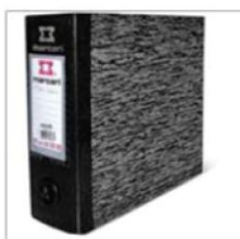
Registradores A/Z ofício Composição: papelão revestido interna e externamente com (plástico); Dimensões: (345mmx285mmx75 mm)