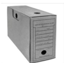
Arquivo morto (papelão) Composição: papelão com duas capas de Kraft; Dimensões: (350 mm X 140 mm X 250 mm)