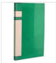
Pasta (plástico) com grampo mola Composição: cartão duplex; Dimensões: ofício