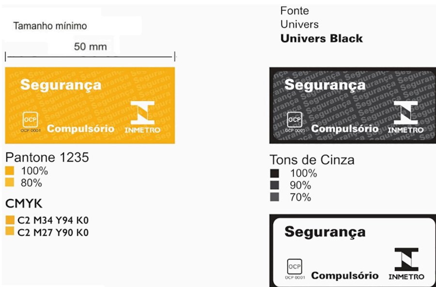
Figura 3 - Selos de Identificação da Conformidade para a embalagem

2.2 Este selo não é aplicável ao Modelo de Situação para Produto Importado (SPI).