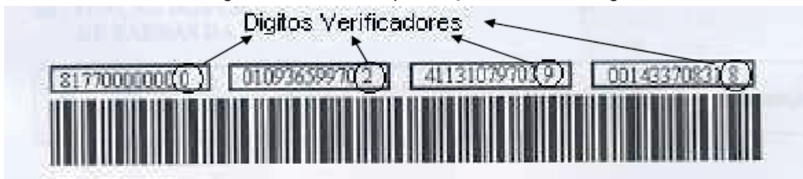
FIGURA C – Dígitos Verificadores da representação Numérica do Código de Barras