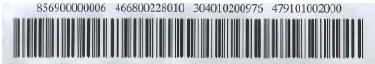
FIGURA B – Código de Barras com sua representação numérica

Este padrão de código de barras possui um dígito verificador geral , e um dígito verificador para cada grupo de 11 posições numéricas.